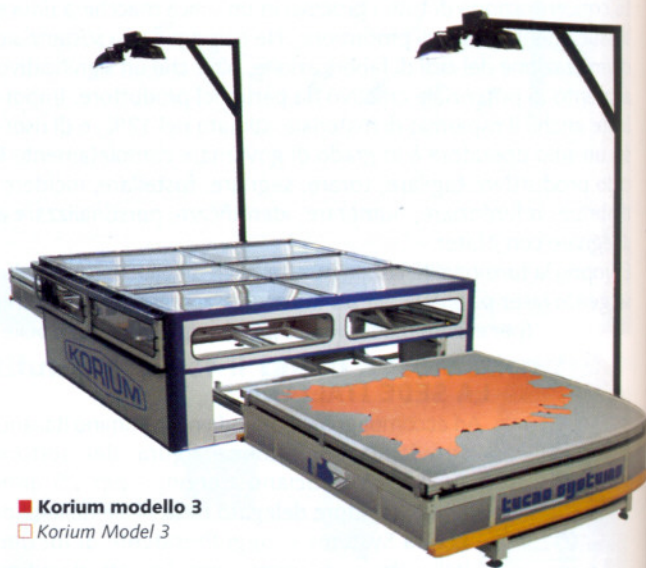
■ Korium modello 3 □ Korium Model 3

La versione on-line prevede che i diversi passaggi di lavorazione della pelle siano eseguiti l'uno di seguito all'altro, partendo quindi dalla rilevazione dei difetti e dalla loro marcatura, per passare alla scansione ed al successivo nesting automatico delle dime ed infine al taglio. La versione off-line , che permette di sfruttare al meglio l'elevata modularità di questo sistema, prevede tre fasi. La prima è l'acquisizione dell'immagine della pelle, dopo che questa è stata opportunamente controllata dall'operatore e ne sono stati eviden-